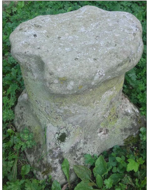
boven: Kerckespraaksteen bij de kerk in Voorst

Op de dag van de verkoop kwamen de gegadigden bij elkaar in de herberg, bij voorkeur aan een ronde tafel. Er werd een pot met snuif- en/of pruimtabak neergezet, evenals een fles brandewijn. Het lag aan de waard of er ook een kwispedoor bij werd gezet of dat men moest “proberen” om de open haard te bereiken. Nadat ook een blaker met kaars op tafel was gezet en met een tondeldoos was aangestoken kon het bieden beginnen.