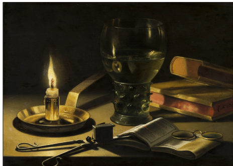
links: Stilleven met brandende kaars, Pieter Claesz, Mauritshuis, Den Haag

Na afloop, als de koper bekend was, werd er een symbolische overdracht van de grond gedaan. De verkoper sprong bijvoorbeeld met een stok over de heg of greppel die het land omgaf, om aan te duiden dat hij het land verliet. Bij een aangrenzend land van de nieuwe koper kon de verkoper een handvol grond over de omheining op het land van de nieuwe eigenaar gooien.