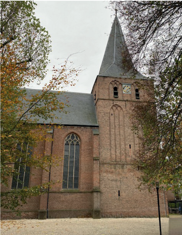
De dorpskerk in Twello

voorging als predikant van Twello en die mensen moet hebben gekend wier vader of grootvader getuige was geweest van de dorpstragedie.