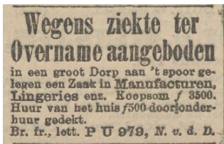
Afb. 4. Dit soort krantenadvertenties kun je vaak vinden in de kranten uit die tijd. (Nieuws van de Dag 15 maart 1901,)