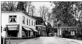
Afb. 5 en 6. Het winkelpand in Twello van twee kanten: Links een foto uit 1911. Rechts de situatie rond 1970. In het pand zaten in 1911 twee winkels: vooraan een manufacturenzaak en met het rode dak een meubelzaak, waarvan later de gevel recht wordt getrokken met de voorste winkel, zie foto uit 1970. Het woonhuis van Jan en Barta begint op de rechterfoto bij de paaltjes, links onder.