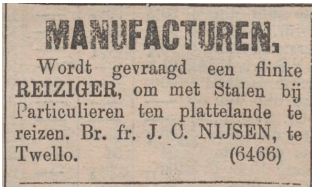
Afb. 7. Advertentie in De Tijd 3 september 1902.

Jan heeft ook reizigers in dienst om zo een schare klanten op het platteland te kunnen bedienen. Met de manufacturenhandel in een koets met paard bestreek hij ruwweg de dorpen langs de IJssel van Hattem bij Zwolle in het noorden tot Lathum bij Arnhem in het zuiden.