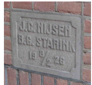
Afb. 8 Herinnering aan eerste steenlegging op 8 februari 1926