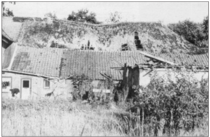
Het vervallen achterhuis in 1990

Ondanks deze slechte staat wordt de 'Gietelse Brouwerij' gelukkig begin 1987 op de gemeentelijke monumentenlijst geplaatst. In 1990 was het huis sterk vervallen. De nok van het huis was doorgezakt en het rieten dak vertoonde grote gaten. Het voorhuis was nog wel te bewonen maar de dakgoot was verzakt en er ontbraken grote stukken van het pannendak.