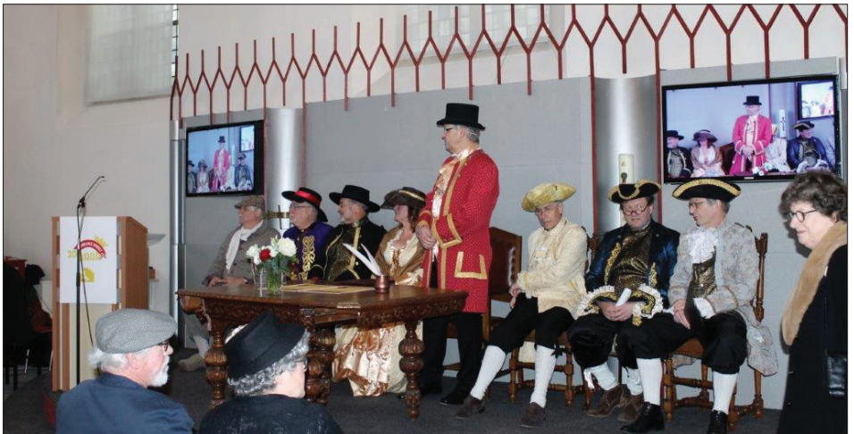
Opening van het Voorst200-jaar in de Dorpskerk in Twello op 1 januari 2018

Het oogenblik is gebooren, waarop wij ons Nationaal bestaan hernemen; de zegepraal der Bondgenooten heeft de hoogmoed van onzen onderdrukker vernederd, heeft zijne reuzemagt vergruist. Moede van het juk te torschen, waaronder men ons zoo schandelijk deed bukken, gevoelt elk Nederlander zijnen moed ontvlammen in dit plechtig oogenblik. Nationale Vrijheid en Onafhankelijkheid is ieders leus, ORANJE, het punt der algemeene vereeniging van al wat trotsch is op den naam van Nederlander.