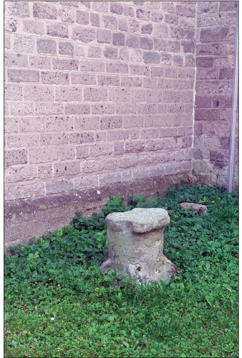
De kerkespraak-steen bij de kerk in Voorst

De kerk was een belangrijke nieuwsbron. De koster, die ook werkte als klokkenluider, voorzanger en doodgraver, had naast deze kerkelijke taken ook nog publieke taken als het geven van onderwijs en het afkondigen van bekendmakingen van de overheid. Dit fenomeen van de kerkespraak vond plaats na afloop van de kerkdienst. In het dorp Voorst stond hij buiten op een steen bij de kerktoren. Die steen staat er nog steeds.