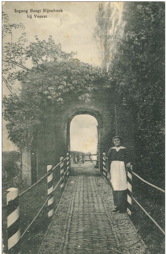
Ansichtkaart van de ingang van De Nijenbeek rond ongeveer 1920

Deventer was door de aanwezigheid van Geert Grote en zijn moderne devoten al een echte boekenstad geworden. Geschreven boeken wel te verstaan, handschriften. Na de uitvinding van de boekdrukkunst vestigden zich ook al gauw drukkers in de stad. De boekenproductie werd enorm verhoogd. Het duurde echter nog een hele tijd voor het eerste gedrukte nieuwsbericht in de Nederlanden verscheen.