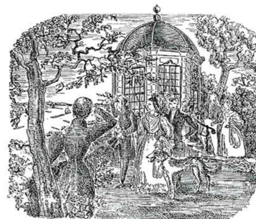
Een bekoorlijk uitzicht op den IJssel

van lelijkheid. Op den ouden Gotischen toren staat een bespottelijk klein koepeltjen van nieuwerwetsche bouworde. De wallen storten in: de versterkingen worden verwaarloosd.