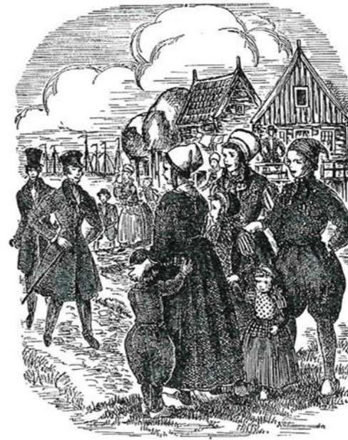
Het voetvolk van Monnikendam begroet de hoge heren: 'Kaik, dat is nou zen Hooghbaai'