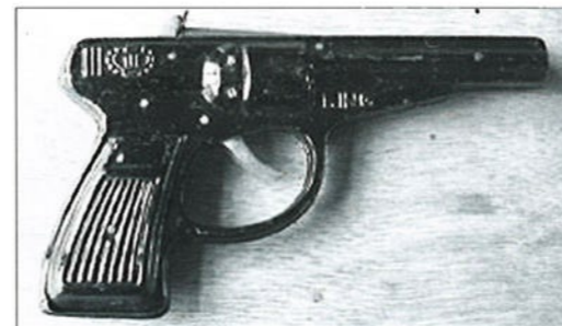
Een jeugdig 'pets'-pistool