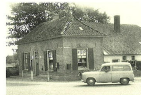
Op de foto uit 1960 gaat de bakker met de bestelauto op weg om brood te bezorgen.

Het bedrijf is tegenwoordig uitgebreid met een koffie/theeschenkerij waar fietsers en wandelaars een welkome pauze kunnen houden. De bakkerij is geregeld doel van excursies. Er gaan dan steevast eigen-gemaakte produkten mee naar huis. Op de foto uit 1960 gaat de bakker met de bestelauto op weg om brood te bezorgen.