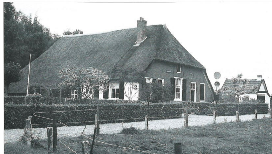
Het Middenzand, Zandenallee 2-2a in Teuge

Boerderijen werden ook genoemd naar personen, meestal de bewoners of eigenaars, bijvoorbeeld Bisschopsbofste , Hoetinkshoeve , Kampborststee en Kuipershuis . De Assenstede werd genoemd naar een