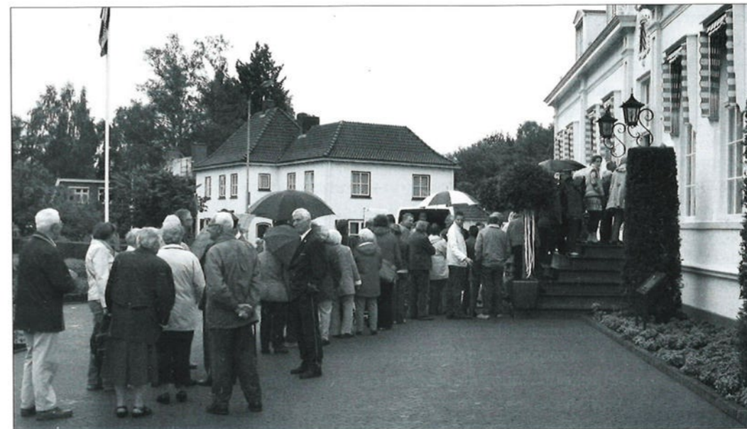
Voor de expositie van trouwfoto's op open monumentendag bestond veel belangstelling.

In maart werd ons onverwacht de huur voor het pand aan de Stationsstraat opgezegd. Er is veel moeite gestoken in het vinden van een nieuwe passende en blijvende accommodatie, maar helaas is dat niet gelukt, meestal wegens te hoge huurkosten. Dankzij de grote inzet van onze vele vrijwilligers konden we op 8 oktober een 'anti-kraak'-pand betrekken aan de Duistervoordseweg 104. Daar mogen wij in ieder geval tot juni 2009 blijven. Het is niet groot maar we zijn er voorlopig mee gered. Intussen wordt er met man en macht