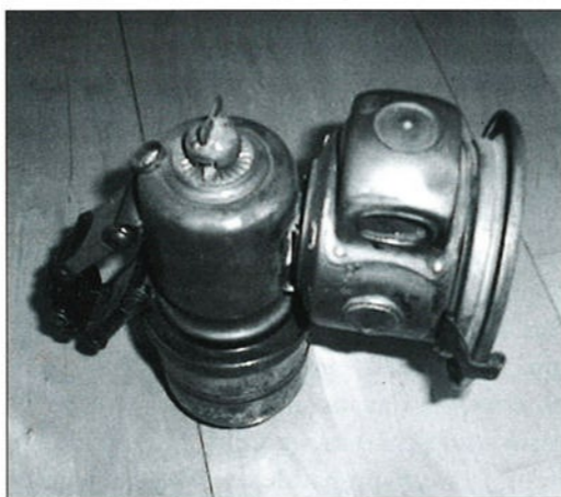
De carbidlantaarn. Aan de linkerkant ziet u de bevestiging voor aan de fiets. Rondom de lantaarn zitten een aantal glaasjes die bet licht ook in de rondte verspreiden.

tyleengas geproduceerd werd. De installatie was helemaal wit uitgeslagen van het carbid. Het gas ging met een leiding naar binnen en daar werd het gemengd met zuurstof uit een cilinder en dan kon autogeen gelast worden. Daar kregen we dan een paar stukjes carbid voor onze donderbus. Het carbid in de verfbus, even erop spugen en dan de deksel er stevig op. De bus werd op zijn kant op de grond gelegd en dan de klomp erop. Met een lucifer werd het gas, dat uit het kleine gaatje in de bodem kwam aangestoken en dan knalde de deksel eraf.