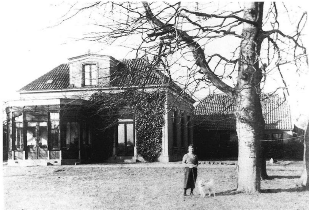
De Bongerd in de jaren '30 van de vorige eeuw.

een Curia met 19 erven of hoeven. Het moet indertijd een aanzienlijk complex van gebouwen zijn geweest, getuige de vele overblijfselen en funderingen in de bodem, waarvan de bekende geschiedschrijver L.A.J.W. Sloet van De Beele in 1863 melding maakt. Deze heer Sloet was toen eigenaar van De Bongerd geworden. Aangetrokken door bovenvermelde gegevens toog schrijver dezes op een najaarsdag in 1974 gewapend met een schop naar de Bongerd, om in een stil hoekje aan de oostzijde van het perceel te beginnen met