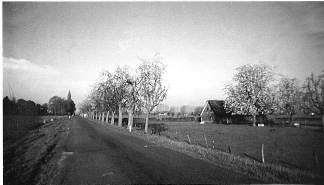
Fruitbomen aan de Kadijk, geplaat met pootrecht.

Maar ook: wie heeft de opbrengsten van het hout, welk recht geldt enzovoort. Omdat we het in onze eigen situatie tegenkwamen ben ik op zoek gegaan naar informatie. Deskundigen over dit thema zijn echter dun gezaaid. Uiteindelijk kwam ik dankzij Annemarie Geerts van het gemeentearchief terecht bij de heer Visser. Van hem mocht ik onderstaand artikel gebruiken als informatie. Toepassen op de eigen situatie raad ik niemand aan, want er zitten nogal wat haken en ogen aan. Bewijsvoering en procedures idem dito.