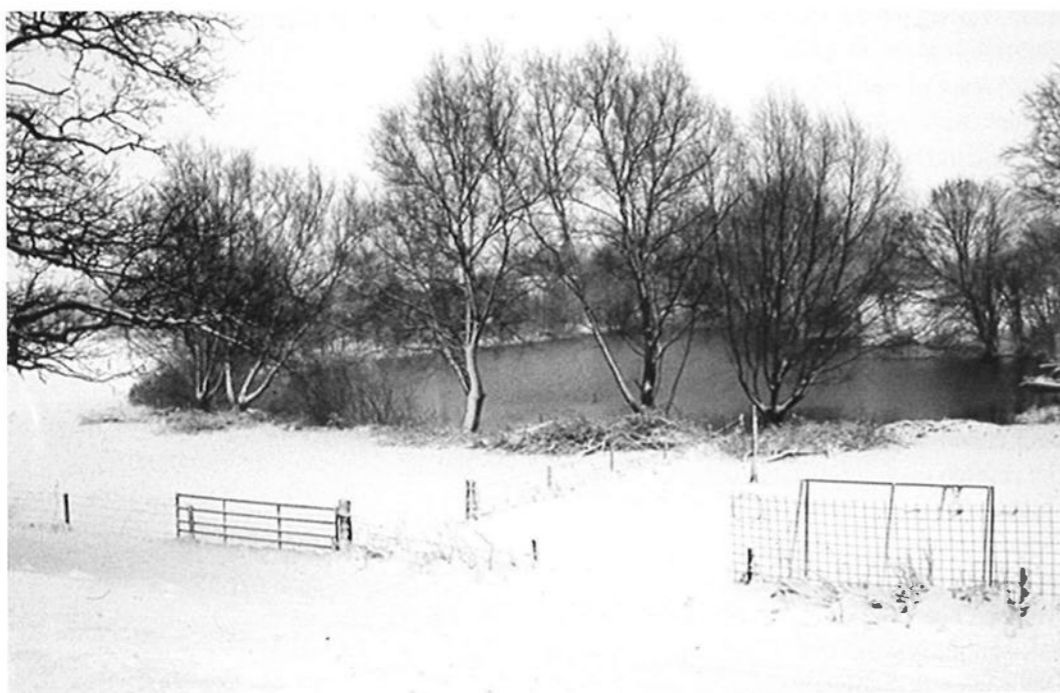
Ook op de kolk bij boerderij Kolkestein werden vaak wedstrijden voor de schooljeugd georganiseerd.

door J. Lubberts een behoorlijke tent zijn geweest. De club had nu de mogelijkheid om op een nette manier en beschermd tegen een koude wind chocolademelk en koek te verkopen. Dit zou zeker het welzijn van de vereniging ten goede komen. Helaas kon de club geen ijsfeest houden in het jaar dat de ijstent gereed kwam. In de vergadering van 1928 werd geklaagd dat de tent te weinig opbracht. De club besloot derhalve de tent te laten aanbesteden. In 1933 was er slechts één inschrijver aan wie dan ook de tent werd gegund. In 1957 werd de tent