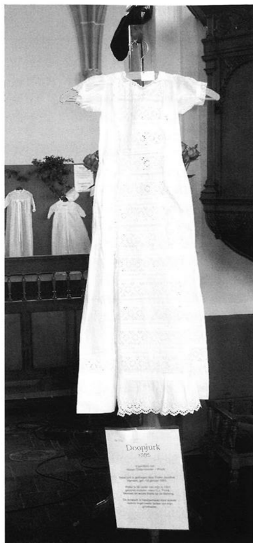
Een van de oudste doopjruken uit 1885.

de zee, gebruikte men in de derde eeuw een poel of bad in een speciaal badhuis. In de twaalfde eeuw werd de kinderdoop steeds gebruikelijker. Door overgieten was slechts een klein bad nodig en langzamerhand is men overgestapt op het gebruik van een doopvont in de kerk. Dit is een grote bak, soms op een dikke poot, waarin wijwater zit. Vroeger moest een kindje binnen drie dagen worden gedoopt, omdat de kindersterfte hoog was. Tegenwoordig wacht men soms drie maanden of nog langer.