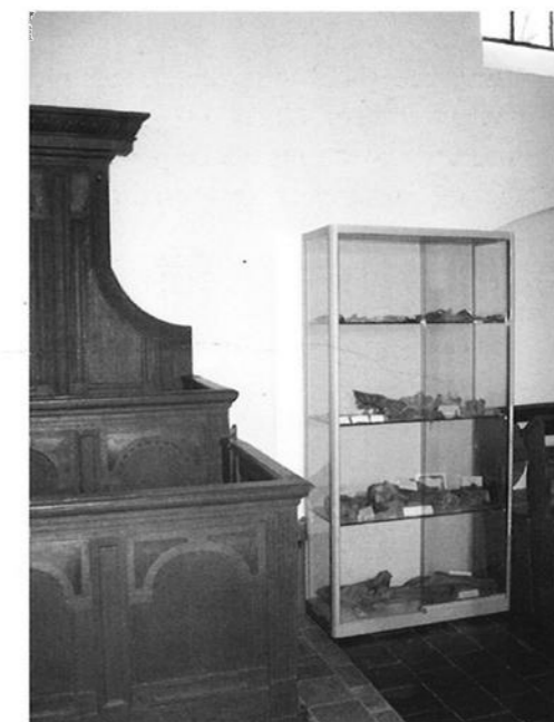
De vondsten op De Bongerd van destijds hebben vorig jaar een permanente plaats gekregen in de dorpskerk van Voorst, die naast De Bongerd staat.

maakt hierop een uitzondering. Hier is moeraserts of oer als grondstof gebruikt. Moeraserts heeft zich in vrij grote hoeveelheden afgezet in de drassige streek tussen de oeverwal van de IJssel en het hooggelegen Veluwemassief. Deze oer is tamelijk hoogwaardige erts, waarvan het ijzergehalte varieert tussen de 45 en 70%. De heer Moerman heeft in zijn beschrijvingen veel analyses laten trekken van slakken afkomstig van ovens die klappersteen als grondstof gebruikten. Van ijzerfabricage uit oer is minder bekend, maar deze zal waarschijnlijk niet veel verschillen van de methode zoals die op de Veluwe werd toegepast.