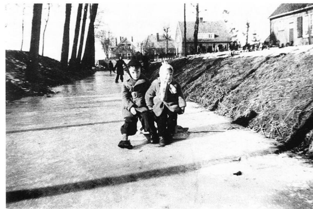
Schaatsen en met de slee op de niet meer bestaande gracht bij het Tuindorp.

gehad met de opslag van de tent. In het seizoen 1966-1967 waaide de tent door de verlichtingskabel met veel schade tot gevolg. De roep om een vaste tent werd zodoende steeds groter. In het jargon van de IJsclub sprak men nog steeds van tent. Er kwam licht in de duisternis doordat men een geschikt en betaalbaar zomerhuisje op de kop wist te tikken. Een eerder aangeboden zomerhuisje was te duur bevonden. Op maandag 29 januari kreeg men van de gemeente toestemming om een vast onderkomen te plaatsen. Het zomerhuisje, gekocht in Apeldoorn, werd in record tempo afgebroken, opgeladen en naar de ijsbaan aan de Kadijk getransporteerd.