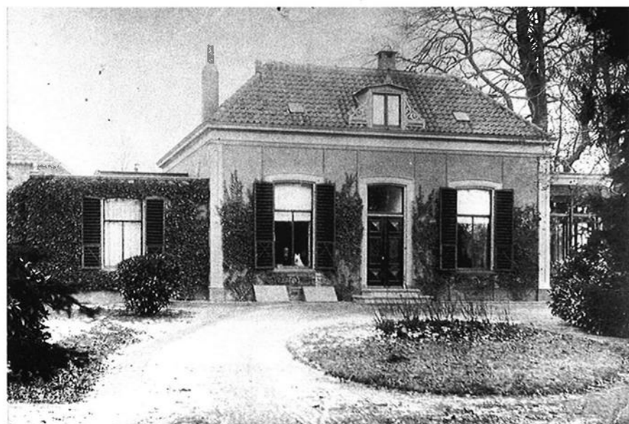
De Bongerd, begin 20e eeuw.

In deze ovens kan men door middel van blaasbalgen een temperatuur bereiken van 1100^\circ à 1200^\circ C., waardoor de slak vloeibaar werd. Deze slak tapte men door een gat onder in de oven af. In de oven bleef dan een poreuze ruwe klomp ijzer achter, de wolf genaamd. De ijzerdeeltjes werden dus niet gesmolten (smeltpunt 1530^\circ C)