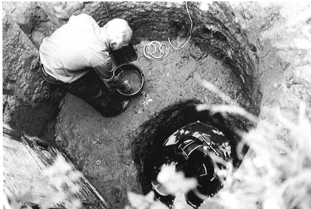
Ten Hove aan het opgraven in de put bij De Bongerd.

Wegens opkomend grondwater kon de put jammer genoeg niet geruimd worden. Rondom de put werden een aantal dikwandige scherven aangetroffen, welke door het Rijks Oudheidkundig Bodemonderzoek werden herkend als aardewerk uit de IJzertijd. Dit was een verrassende