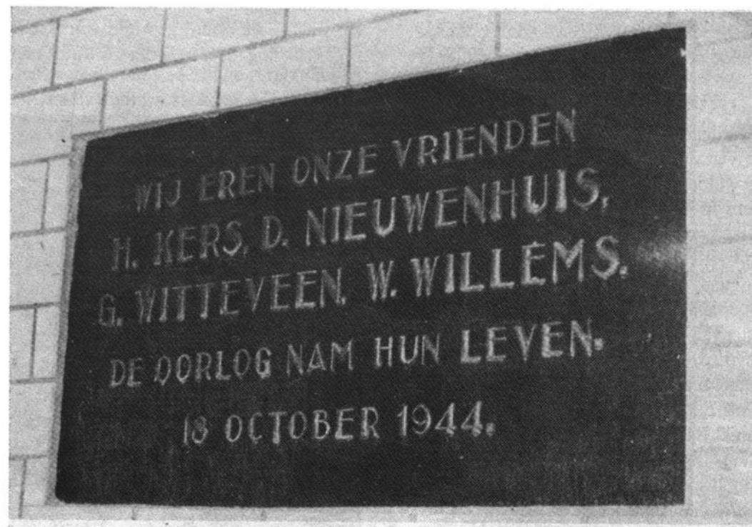
De gedenksteen in de verzendhal van Coveco, ter herdenking aan de slachtoffers van het bombardement op 18 oktober 1944.