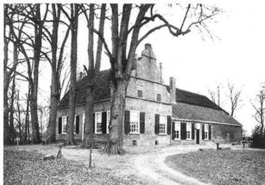
De Adelaar in Voorst.

Wij hopen u te kunnen verwelkomen op 17 december a.s.