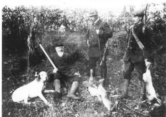
Een jachtpartij op "de Poll" (circa 1920).

Verder was de vraag van de officier of er de laatste tijd nog iets ten nadele of ten voordele van de man valt op te merken. Tot zover het verhaal over de jacht. Barmentloo is wel jachttopziener/onbezoldigd rijksveldwachter gebleven.