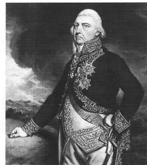
Jan Hendrik van Kinsbergen (1735-1819), destijds bewoner van het bekende Apeldoornse landgoed Welgelegen. Van Kinsbergen was Oranjeklant maar ook een filantroop voor het dorp Apeldoorn. Zieken, armen en wezen konden op zijn steun rekenen.

Bij herberg de Zwaan aangekomen kregen ze bericht dat het dorp Twello was bezet