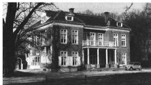
'Wijnbergen', aan het eind van de negentiende eeuw eigendom van mademoiselle Crommelin van Wijnbergen.

Dit ging echter niet zonder slag of stoot. Op de achtste september werd door de heer