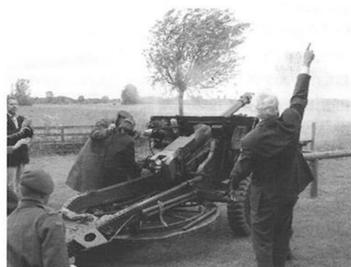
Het saluutschot afgevuurd door een veteraan van het regiment Hastings and Prince Edwards.

een bijzonder moment om weer in deze omgeving te zijn. Met hem hebben we op 7 mei ook nog de tijdelijke begraafplaats aan de Rijksstraatweg in Teuge bezocht. Hier lagen een aantal kameraden van zijn regiment (Hastings and Prince Edwards) begraven.