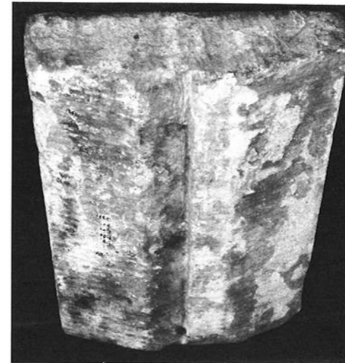
De achterzijde van de gevelsteen zoals die dienst heeft gedaan als kantmontant van een Gotisch kerkraam. Duidelijk is de sponning te zien waarin het glas-in-loodraam was aangebracht en de openingen waarin de stangen waren bevestigd die het raam zijn samenhang en stevigheid moesten geven.

* Ook is het mogelijk dat de steen niet als kantmontant heeft gediend maar als een bovendorpel van een kruisvenster. Omdat Bentheimer zandsteen veel duurder was