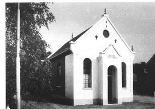
Pniël na de restauratie.