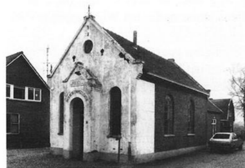
Pniël vóór de restauratie (jaren '60).

In het jaar 1913 kwamen woning en lokaal