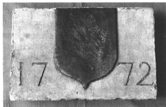
De gevelsteen zoals die generaties lang op de zolder van de Kleine Noordijk moet hebben gelegen.