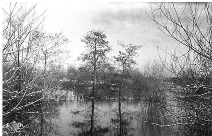
Winters landschap bij hoog water.

Hoe het landschap in onze omgeving zich verder gaat ontwikkelen is moeilijk te zeggen. De huidige ontwikkelingen en onzekerheid in de landbouw maakt het moeilijk om een blik vooruit te werpen. Wordt extensieve landbouw in combinatie met recreatief medegebruik de toekomst? Natuurbeheerders doen er de afgelopen jaren in ieder geval hun best voor om de waardevolle landschapselementen die er nog zijn, te bewaren. Dat dit een kwestie van 'lange adem' is, mag duidelijk zijn.