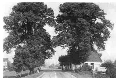
Op de plek waar nu restaurant “Diekhuus” staat, stond vroeger fort “De Morgenster” en later herberg-boerderij “de Volle Hand”.