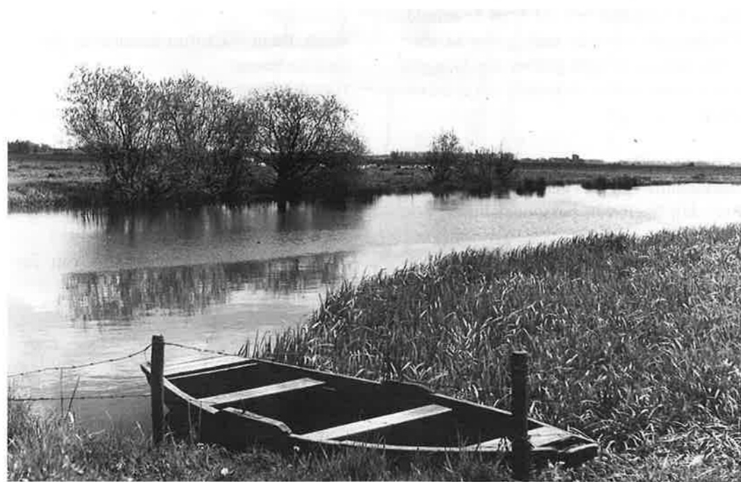
De IJssel, beeldbepalend voor het landschap in deze streek.

De IJssel is van grote invloed geweest op de vorming van het landschap in deze streek. De rivier wierp oeverwallen op, waar dorpen ontstonden en deponeerde klei die landbouw mogelijk maakte. Regelmatig verlegde ze haar koers of brak door de dijken. Een aantal van die oude IJsselopen is nog te herkennen in het landschap.