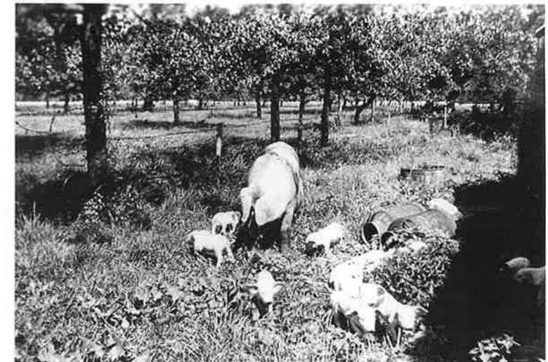
Varkens tussen de hoogstamfruitbomen.

Bij al deze initiatieven is het combineren van natuur en menselijk ingrijpen de uitdaging. Hoe krijg je bijvoorbeeld een landbouwer zo ver, dat hij een stukje van zijn weide beschikbaar stelt om er een eerder gedempte poel weer terug te brengen? Of de afrastering een eindje te verplaatsen