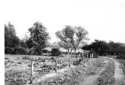
Hagen vormen een natuurlijke afscheiding tussen de weiden.

Om veilig te kunnen wonen op de vruchtbare gronden langs de rivier, werden dijken aangelegd. Er dateren stukjes dijk van zo'n 1000 jaar geleden. In de eeuwen daarna werden alle kleine stukjes dijk met