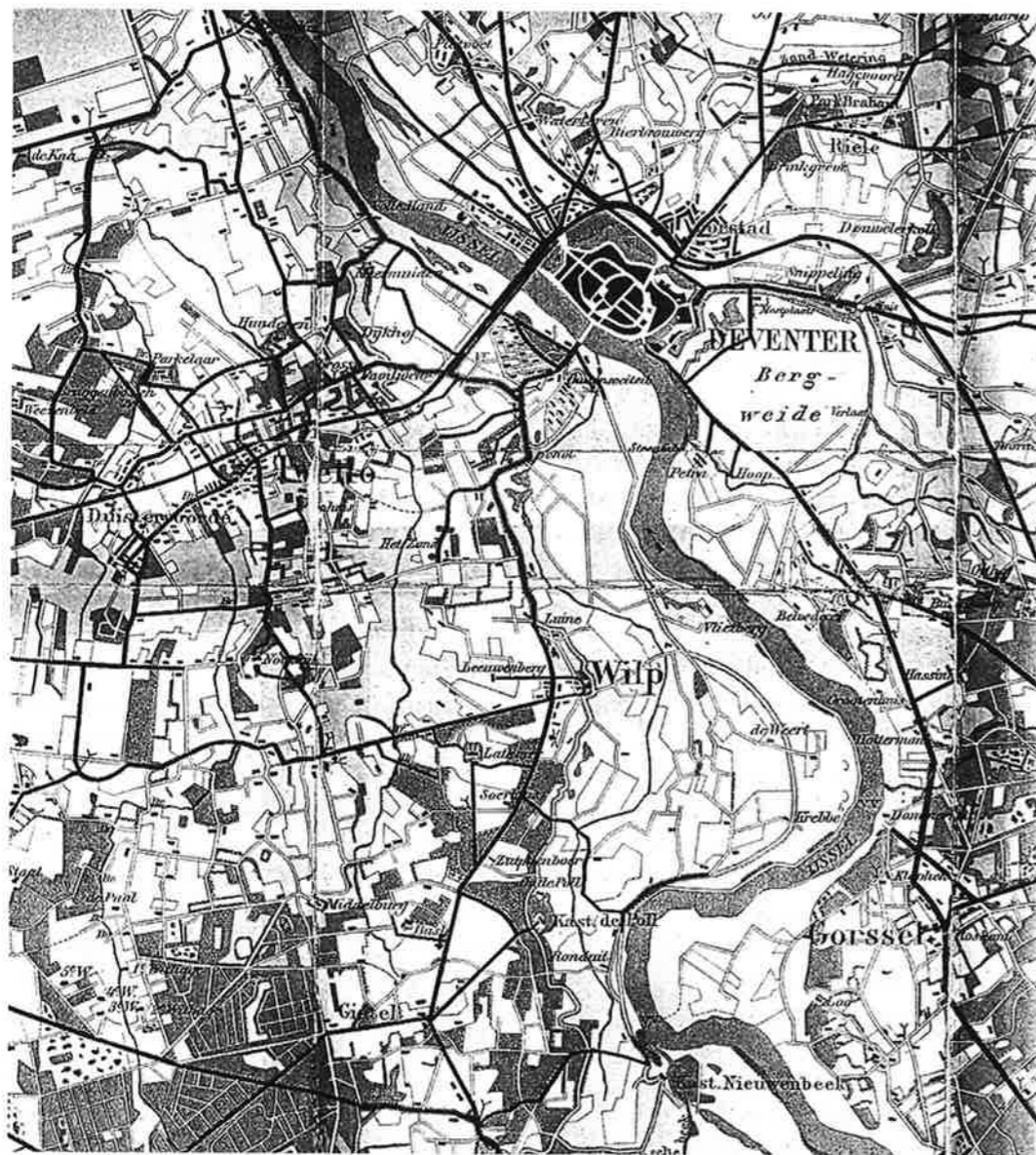
Op deze wandelkaart uit 1901 is onder meer te zien hoe de grillige loop van de IJssel een even grillig kavelpatroon in het uiterwaardengebied heeft veroorzaakt.

ontgonnen worden. Die waren nu niet meer nodig om plaggen te leveren. Bovendien konden als gevolg van verbeteringen in de afwatering door het graven van weteringen ook de lagere en nattere gebieden voor landbouwdoeleinden gebruikt gaan worden. Gevolg van deze ontginningen was dat her en der nieuwe gehuchten en dorpen ontstonden, zoals Wilp-Achterhoek en De Vecht. Ook de verspreide bebouwing nam in de tweede helft van de 19e eeuw toe. Door de vele ontginningen bleven in het gebied tussen de IJssel en de Veluwe, van oudsher een gebied met veel heide, slechts een paar kleine heidevelden over, in de buurt van Voorst en Klarenbeek. De Tondense hei is een voorbeeld van natte heide met blauwgraslanden, gevoed door kwelwater vanaf de Veluwe. Ze worden niet tot matig bemest en gebruikt als hooiland.