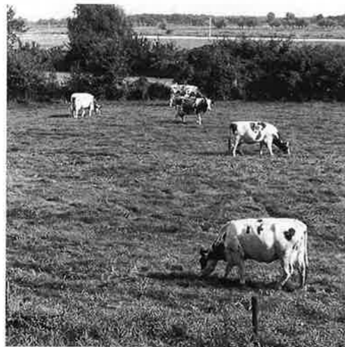
Koeien in de uiterwaarden.

Een ander element van het rivierenlandschap waarvan intussen veel verdwenen is, zijn de hoogstamfruitbomen. Geschat wordt dat deze voor 90% verdwenen zijn. Oorzaak hiervan is dat het lastiger was om het fruit uit deze bomen te plukken. Het is dus arbeidsintensiever dan fruitbomen met een kortere stam. Jaren geleden werden de hoogstamfruitbomen met subsidie geroid. Nu is er een financiële regeling om hoogstamfruitboomgaarden in stand te houden of terug te brengen.