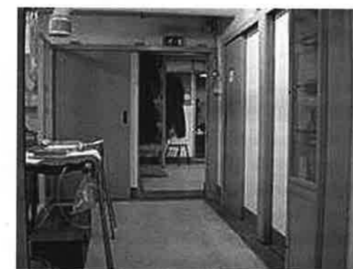
De hospitaalbunker in het Haere-bos.

Door de enthousiaste inbreng van de medewerkers van de Stichting de IJssellinie en mede door het fraaie weer was het een leerzame en prettige excursie.