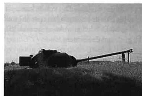
De ingegraven Sherman tanks langs de IJssel.

De hele operatie werd zoveel mogelijk geheim gehouden. Een deelnemer aan de excursie die oorspronkelijk uit Olst kwam vertelde dat de bewoners van niets wisten en dat zij ver van het complex werden ge-