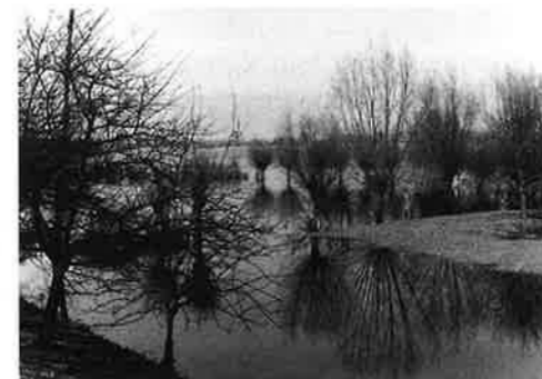
Knotwilgen met de 'voeten in het water'.

In de 14e eeuw werden in het hele gebied gronden ontgonnen. Waarschijnlijk dwong een groei van de bevolking hiertoe. Naast veeteelt werd ook de verbouw van granen steeds belangrijker. Kleigronden langs de IJssel werden in gebruik genomen, maar