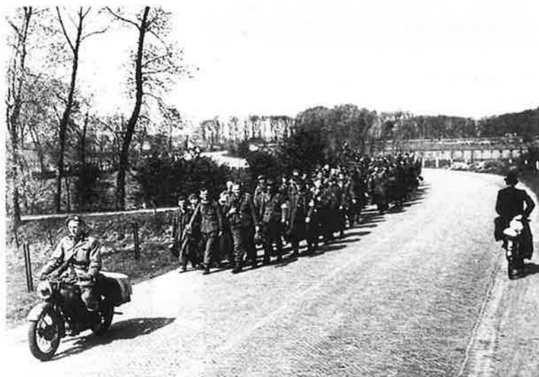
Eén van de foto's die volgend jaar op de expositie op de Wilpse Klei te zien zal zijn: gevangengenomen Duitse soldaten worden over de Wilpse dijk afgevoerd (april 1945).