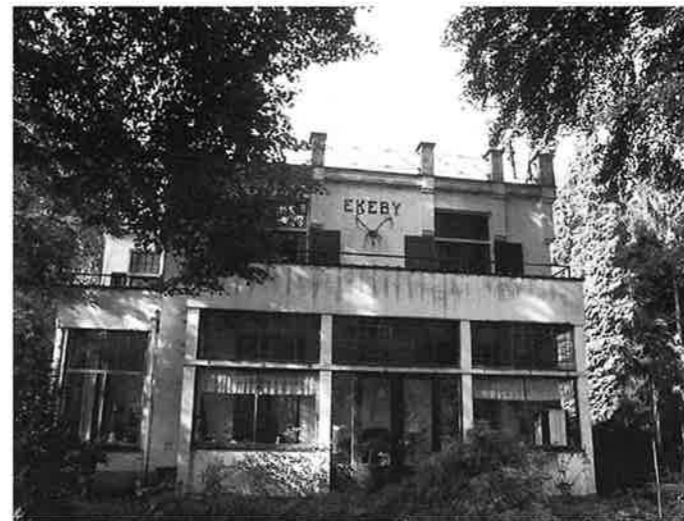
Huize Ekeby in de bossen van het Appensche veld. Onder de gevelletters "Ekeby" een hertengewei.

Tijdens dit inventarisatiewerk stuitte wij op een in kubistische stijl gebouwde villa aan de Watergatstraat nr. 8 te Voorst. De villa, gelegen in de bossen van het Appensche veld, draagt in de gevel de naam Ekeby. Het is gemaakt van ingemetselde bakstenen, die gestuukt zijn, opzij wit en aan de voorkant zwart geschilderd. Onder de naam is een hertengewei aangebracht. Bij het doorspitten van het gemeentearchief naar gegevens over deze villa bleek dat er - in tegenstelling tot de meeste andere objecten binnen de gemeente Voorst - van deze villa weinig of niets bekend was. En dan begint het voor ons interessant te worden, want juist witte plekken in het archief hebben onze bijzondere belangstelling. Allereerst ging de belangstelling uit naar