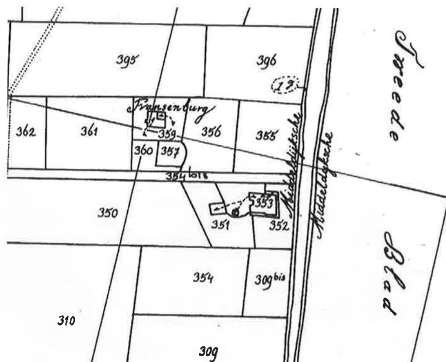
De Fransenburg, aangegeven op de kadastrale kaart uit 1832.