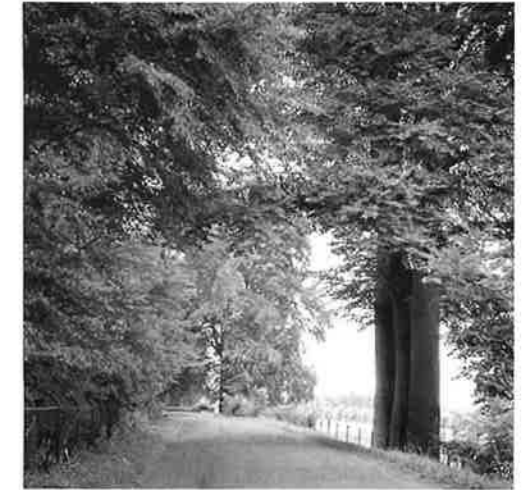
Bomen op de Bandijk bij Terwolde.