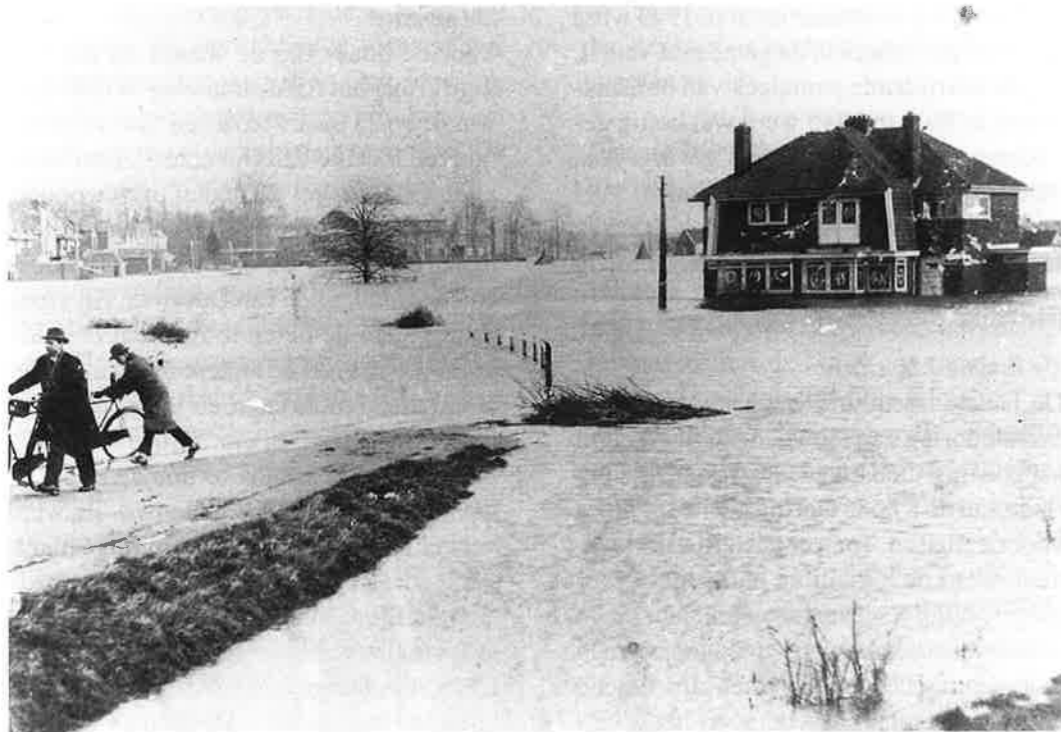
Waar nu het kruispunt Rijksstraatweg-Wilpsedijk-Twelloseweg is, werd in de 16e eeuw een verdedigingsschans gebouwd. Op deze foto zien we dat op deze plek niet alleen krijgshandelingen voor gevaarlijke situaties zorgden.

een blokhuis gebouwd door Hertog Karel van Gelre, genoemd "De Altena". In de Franse tijd ging het er ook roerig aan toe rond het Diekhuus en het hier aanwezige veer. Dit veer ging vlak bij de toenmalige herberg-boerderij over de IJssel. Teven was er een loswal voor aan- en afvoer van goederen. De Franse bezettingstroepen van de stad Deventer hebben de herberg rond 1800 in brand gestoken. In 1814 hebben de kozakken getracht hier een overgang over de dichtgevroren IJssel te maken. De oorspronkelijke, eeuwenoude naam, van de herberg-boerderij was "De Volle