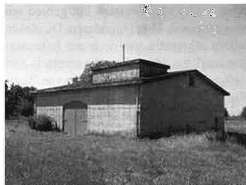
Het Light Anti-Aircraft Controle Centre, gelegen aan de westkant van de IJssel.

De Nederlandse kapitein J.C.E. Haex kwam met het voorstel om een waterlinie aan te leggen; dat zou zeker drie divisies kunnen schelen. Het idee van de IJssellinie werd overgenomen door de Nederlandse