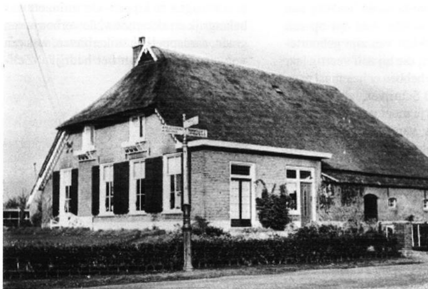
‘De Bellert’ aan de Kadijk (1961).

Zo successievelijk veranderde het bedrijf, het ‘ontmengde’. De kippen gingen er eigenlijk als eerste uit. En ook de akkerbouw verdween in de loop van de jaren van De Bellert, in die zin: er kwam mais voor in de plaats. En dat is eigenlijk een gewas voor de veehouderij. Het fruit is verdwenen,