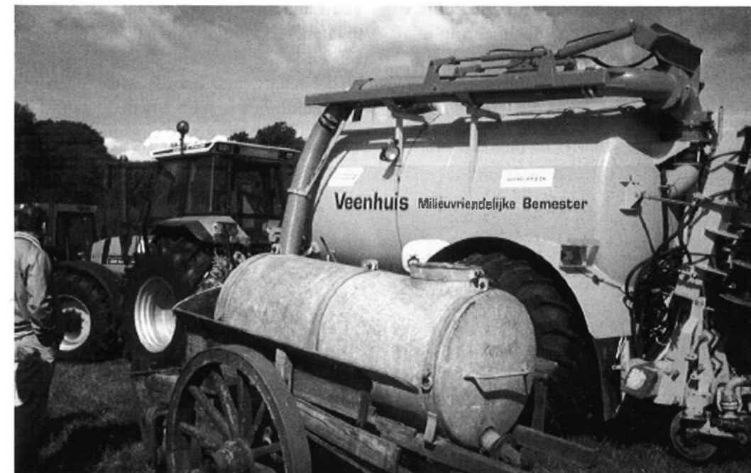
...en moderne landbouwwerkzaamheden (machinaal bemesten).

Het klinkt als iets uit voorhistorische tijden, maar in die jaren werkte de Europese Unie met een begroting van 100 miljard euro en bijna de helft ervan, 43 miljard, ging op aan landbouw. Voornamelijk aan subsidies die producten van Europese boeren - met name granen, zuivel en rundvlees - zo goedkoop moesten houden dat ze ermee konden concurreren op de wereldmarkt. Zoveel belastinggeld voor een bedrijfstak die macro-economisch gezien van niet al te grote betekenis meer was en die door epidemische veeziekten, voedsel-