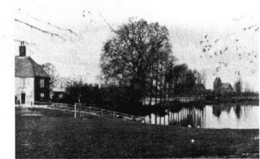
Boerderij 'Kolkenstein' met achter de kolk de kerk van Terwolde (1922).