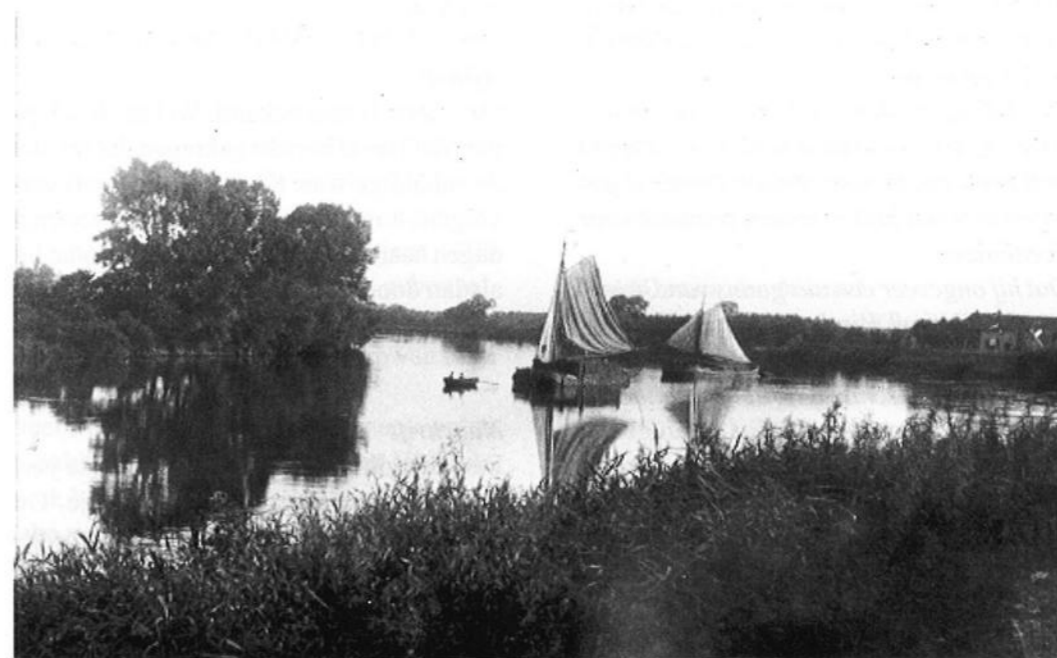
Binnenschepen op de IJssel, ter hoogte van de Houtwalstraat (rechtsachter 'Het Lokin'), 1925.

Dat comparant a.s. woensdag weder van hier naar Deventer met zijn vaartuig vertrekt en wel per sleepboot en zo deze er