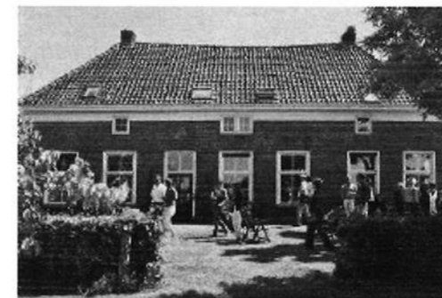
Te gast op IJsselhoeve 'de Telbrink' in Marle.

Roger Crols van het Gelders Genootschap vertelde over de oorsprong van de boerderijen in de IJsselvallei: de deelnemers kregen een beeld van kenmerkende elementen van de boerderijbouw in het gebied, de inrichting van de boerderijen en de stijlen