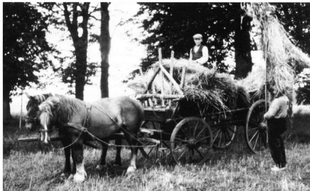
Vroegere landbouwwerkzaamheden (rogge opsteken bij De Poll)...

En de boer, hij verdween Ons platteland in het jaar 2103