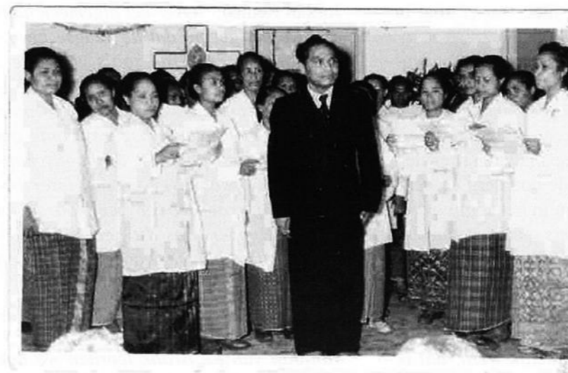
Het dameszangkoor in de kantine.

Ook op basis van de oorspronkelijke herkomst (Ambon, Ceram, de Kei-eilanden) en godsdienst (Moluks-evangelisch, katho-