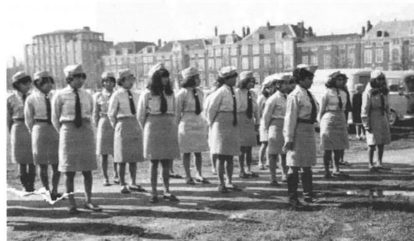
Parade van meisjes uit Teuge op het Malieveld in Den Haag, ter gelegenheid van de viering van 25 april.

De taal was in het begin een groot struikelblok, maar door de omgang met de Ne-