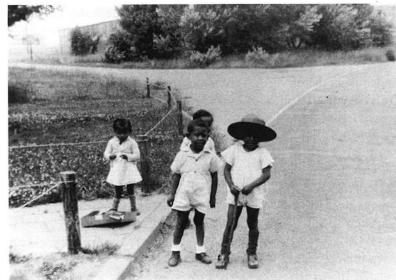
Kinderen bij de ingang van het kamp (25 juni 1951).

De meeste kinderen hadden nauwelijks speelgoed. Zij vermaakten zich met een bal,