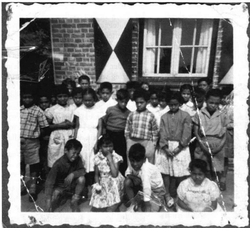
Kinderen voor de kampschool.

één was ingericht als kraamkliniek. Verder was er een keuken en een washok met toiletvoorziening. In de overige drie kamers woonde het gezin van de Molukse verpleegkundige.