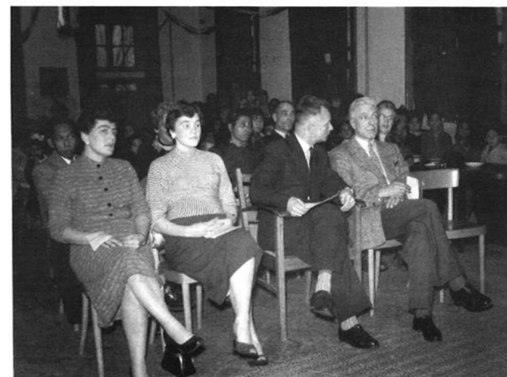
In 1954 bracht een delegatie van het Commissariaat Ambonezen Zorg een bezoek aan kamp Teuge. Er was onder meer een bijeenkomst in de kantine.