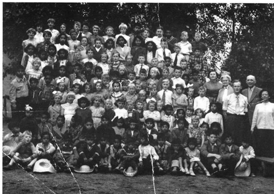
Foto van een schoolreisje van de School met de Bijbel, begin jaren vijftig.

De kampschool werd begin jaren zestig opgeheven. Later heeft het gebouw nog dienst gedaan als woning, totdat het weer een militaire bestemming kreeg. Midden jaren negentig is het gebouw gesloopt.