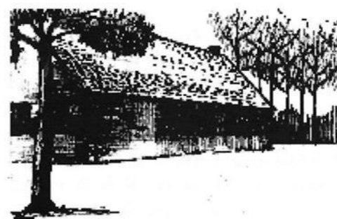
Tekening van één van de barakken in het kamp.