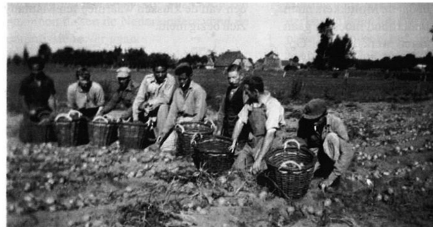
Aardappels rooien bij de boer.

Ook in het verenigingsleven integreerden de Molukkers in de Teugse samenleving. Ze werden lid van de voetbalvereniging, de