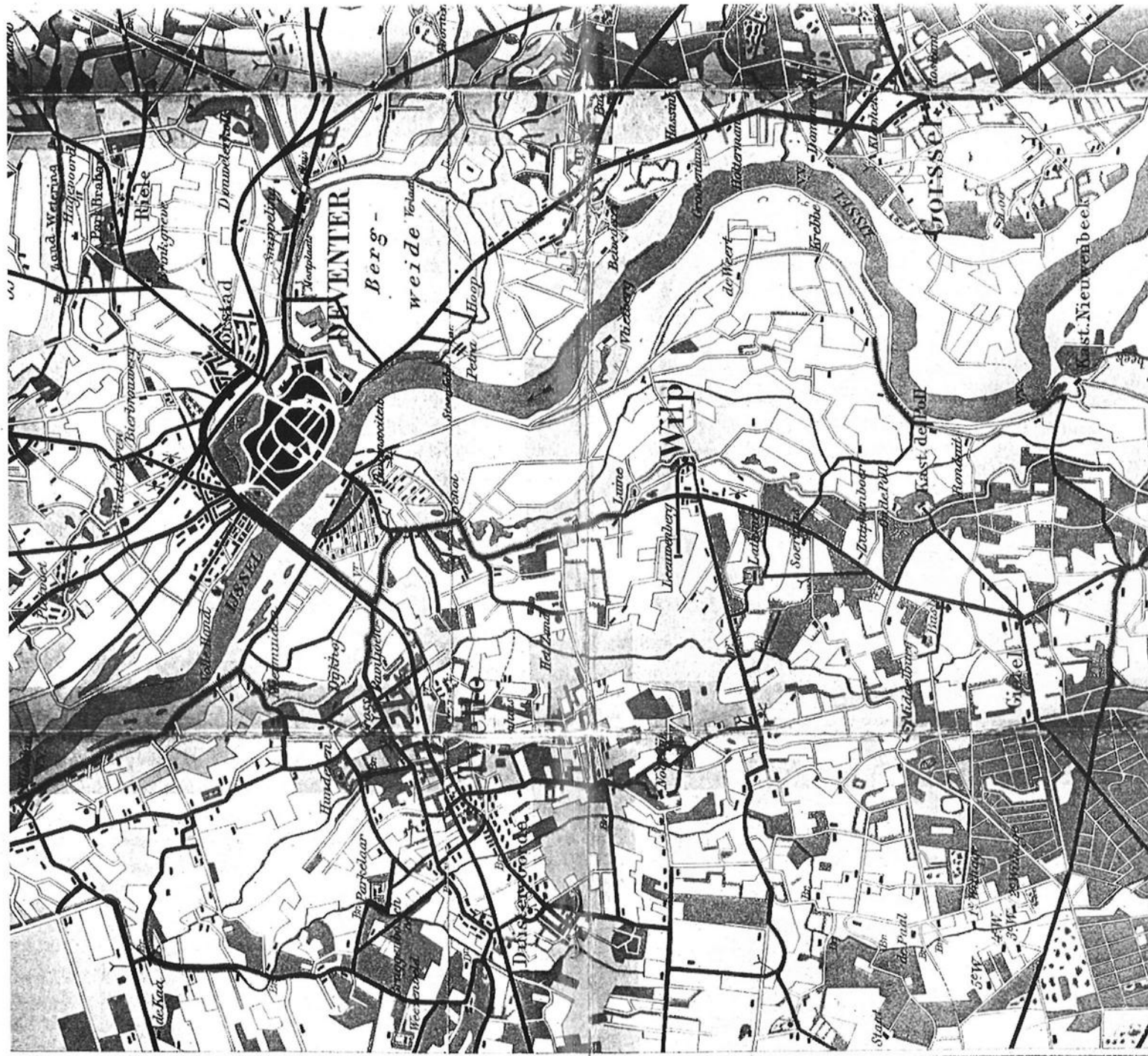
De wandelkaart uit 1901.