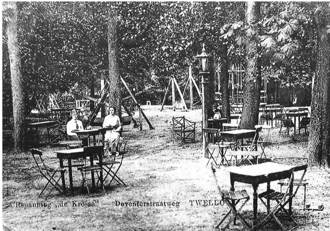
Uitspanning „de Krosse“ — Deventerstraatweg TWELLO