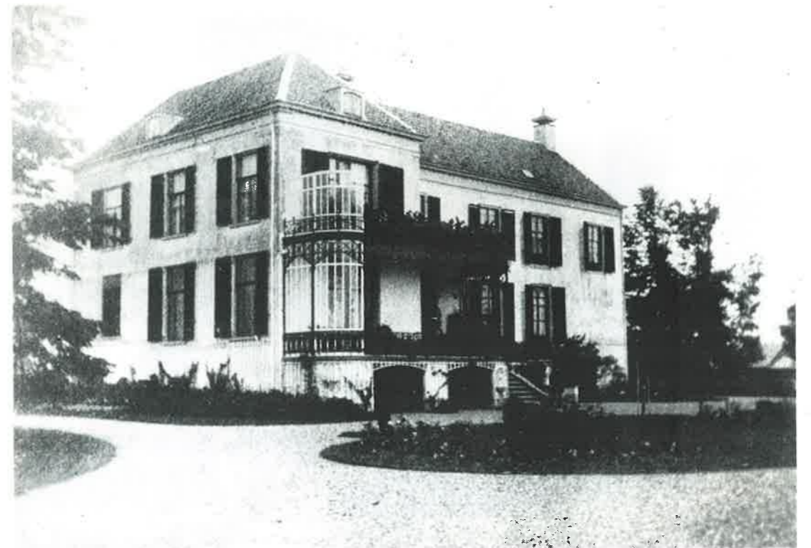
De achterzijde van "de Beele" in 1908. Later werd de veranda dichtgebouwd tot serre.