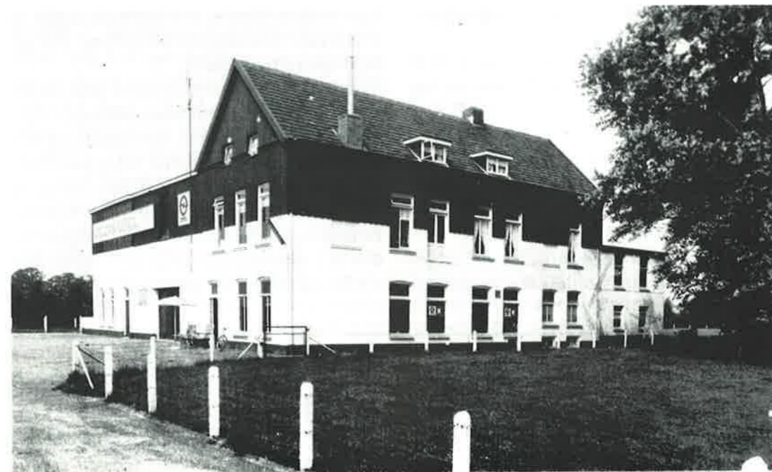
De "Emstermate" of "Hekla" in gebruik bij de firma Boeve als opslagplaats voor auto's (1979).

In het jaar 1975 werd de N.V. Veldkoningshandelmij ondergebracht in Holland United B.V. Deze firma wilde op dit complex uitbreiden, maar kreeg hiervoor geen toestemming. Zij zag zich daardoor genoodzaakt het pand te verlaten.