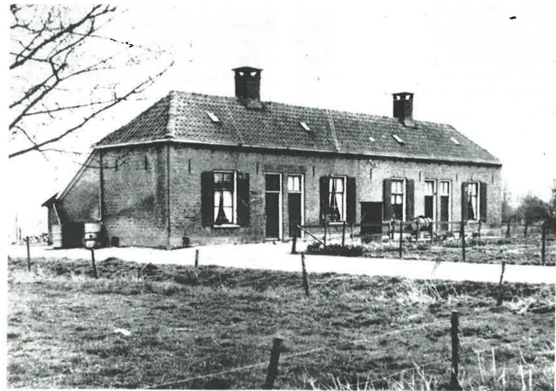
Diakoniewoningen aan de Middendijk in Nijbroek, nr. 44 - 50. De gezamenlijke pomp staat midden voor de woningen.

Verstrekking van geld, levensmiddelen en/of kleding; betalingen aan ingezetenen die een "bestedeling" kost en inwoning verschaffen.