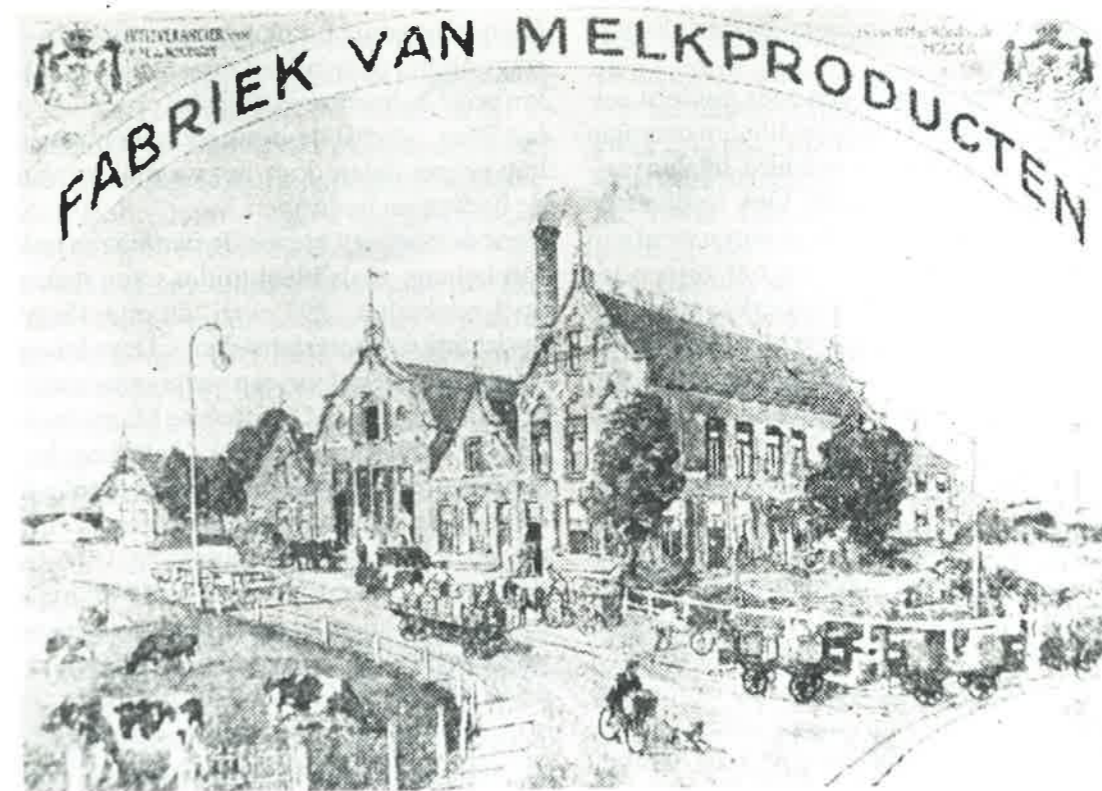
Melkproduktenfabriek "Emstermate" in Terwolde, opgericht door de familie Lugard.

Het bedrijf ging een zonnige toekomst tegemoet, werd hofleverancier en mocht het