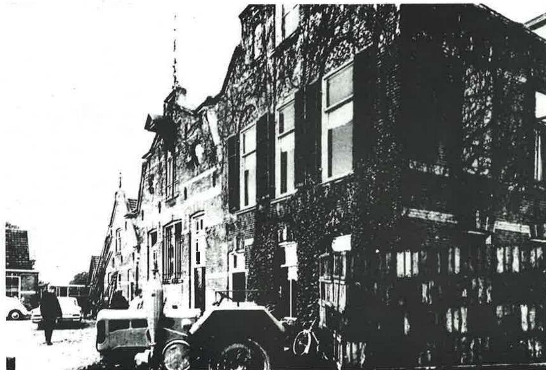
De "Emstermate" in de periode dat ze reeds de naam "Hekla" droeg en geëxploiteerd werd als fruitteeltbedrijf (1947).

leerd in Varsseveld. De verffabriek werd in eerste instantie geleid door de heer Boks die zich in 1921 in Terwolde vestigde. In het jaar 1927 kwam dr Scholten vanuit Indonesië naar Terwolde. In Indonesië had de firma ook fabrieken en wel in Medan en Soerabaja. De fabriek in Terwolde had een succesvolle start. De produktie was - gezien de Maleise tekst op de bussen - bijna geheel bestemd voor Indonesië, het toenmalige Nederlands-Indië. In 1923 werd de petroleummotor vervangen door een 7½ pk electromotor, die de complete inrichting aandreef. Ten behoeve van de veiligheidswet werd opgegeven dat er in dat jaar drie personen werkzaam waren.