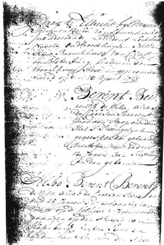
Proces-verbaal voor het Hof van Utrecht in 1728. Criminele sententies deel 99-10 folio 253r e.v.