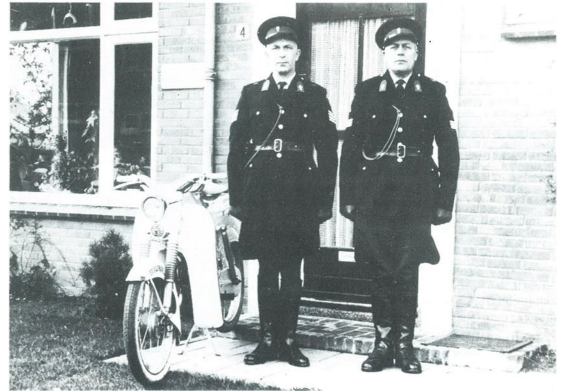
De politie-agenten van Voorst staan vol trots bij hun nieuwste vervoermiddel, een bromfiets (1964).

Tijdens verhoren van meerdere arrestanten zaten de overige op de trap hun beurt af te wachten. Men kan zich voorstellen dat er weinig