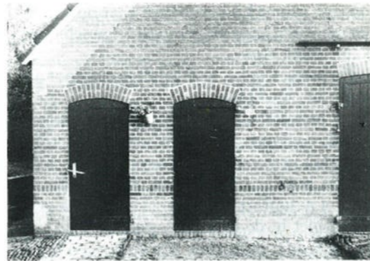
Detail van het linkerdeel van de boerderij.

De boerderij "De Hof de Tuil" staat met het achtereind naar de Wellinkhofweg toe en is dus prachtig te bekijken.