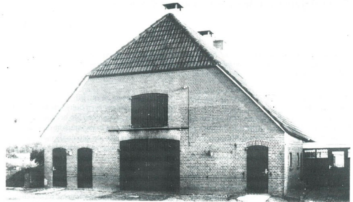
De boerderij "De Hof de Tuil" in 1993.