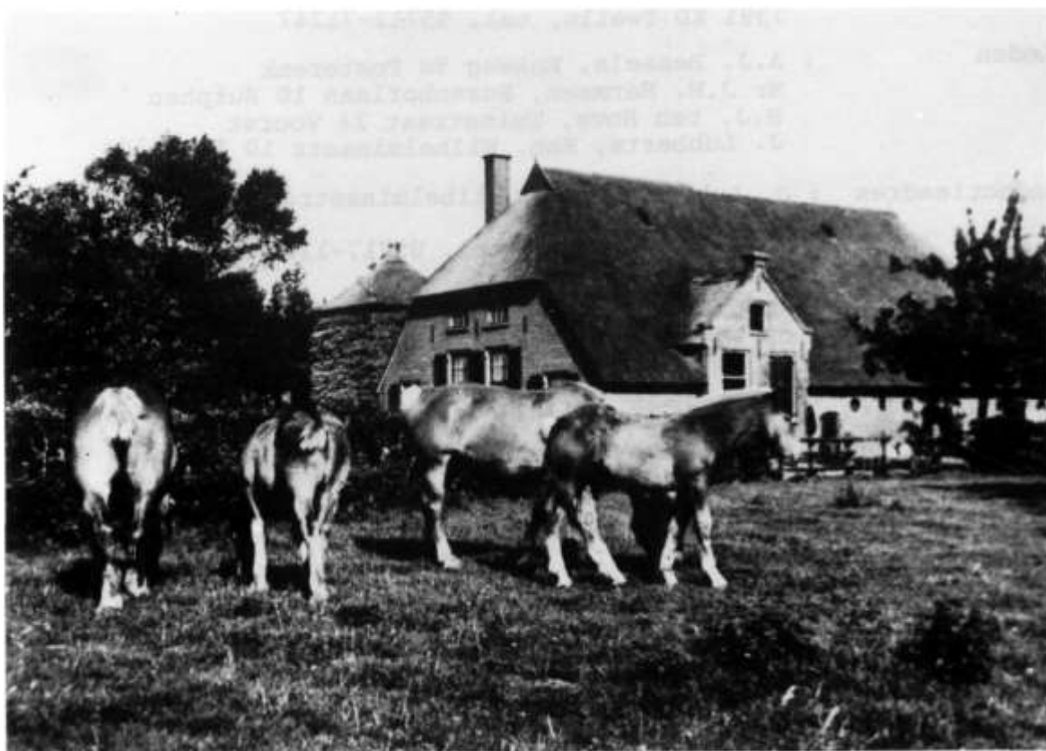
't Lollebroek ca. 1940.

De bijeenkomst op die avond was met 253 aanwezigen zo druk bezocht, dat de avond werd herhaald op 19 mei j.l..