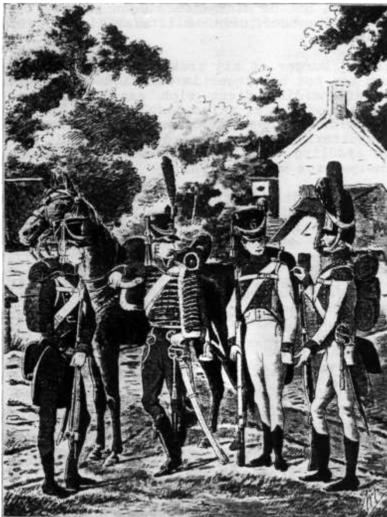
Veldartillerist. Huzaar. Fuselier. Grenadier. Hollandsche uniformen onder Koning Lodewijk

Bij dit optreden door de Nederlandse troepen is zijn werkzaam deel zodanig dat hem daarvoor de hoogste militaire onderscheiding wordt toegekend: Voor zijn Moedig, Beleidvol en Getrouw aan het Gezag optreden bij Beba, benoemt Koning Willem I hem tot Ridder 4e Klasse van de Militaire Willemsorde, op 7 juli 1820.