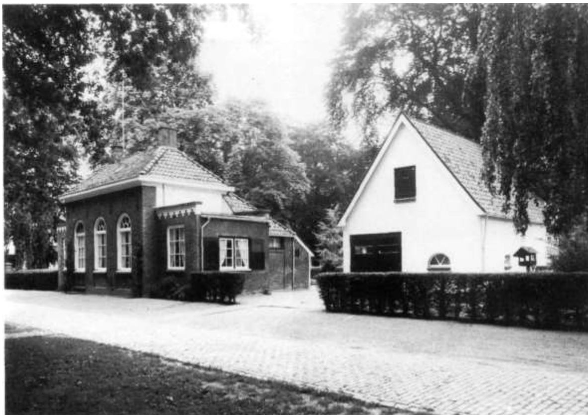
Algemene begraafplaats Gietelo 1988 Coll. Oudh. Kring Voorst.

Onder nummer 35 van vak 1 van de Algemene Begraafplaats te Gietelo, op het oude gedeelte dus, ligt een inwoner van de gemeente Voorst begraven roet een interessante militaire loopbaan welke bekroond werd met de hoogste militaire onderscheiding: Ridder van de Militaire Willemsorde.