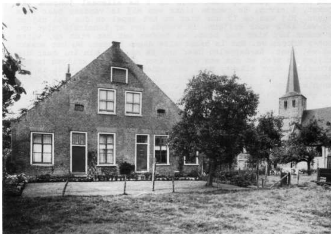
De Keizershof te Voorst.