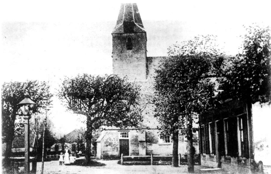
De Kerk te Oene