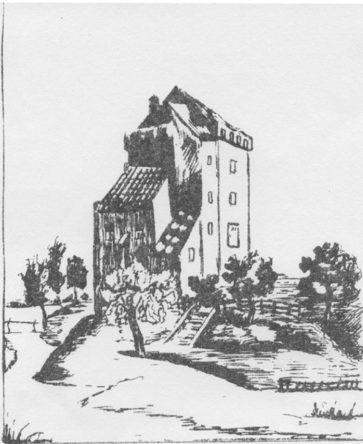
4. Kasteel Nijenbeek.