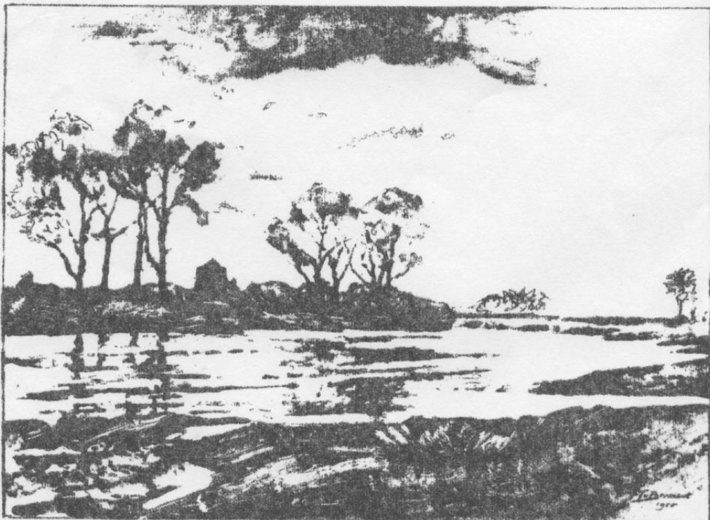
12. De IJssel met de Nijenbeek aan de overzijde, 1955.