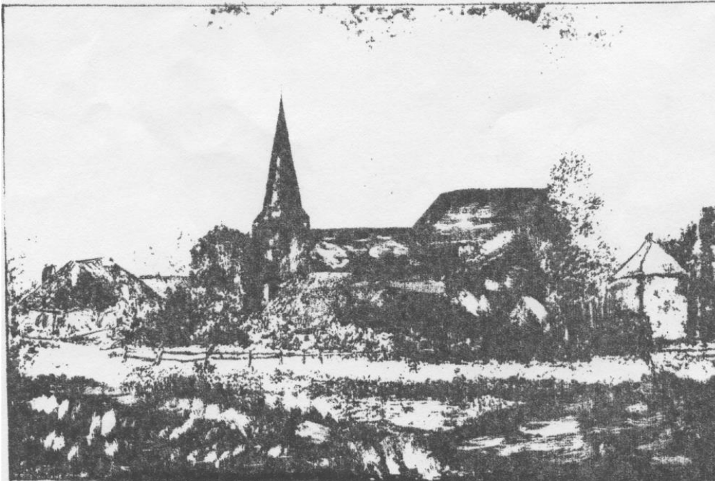
7. De kerk te Wilp.