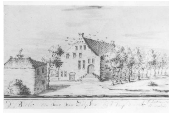
Nr.9 Huis De Biele.