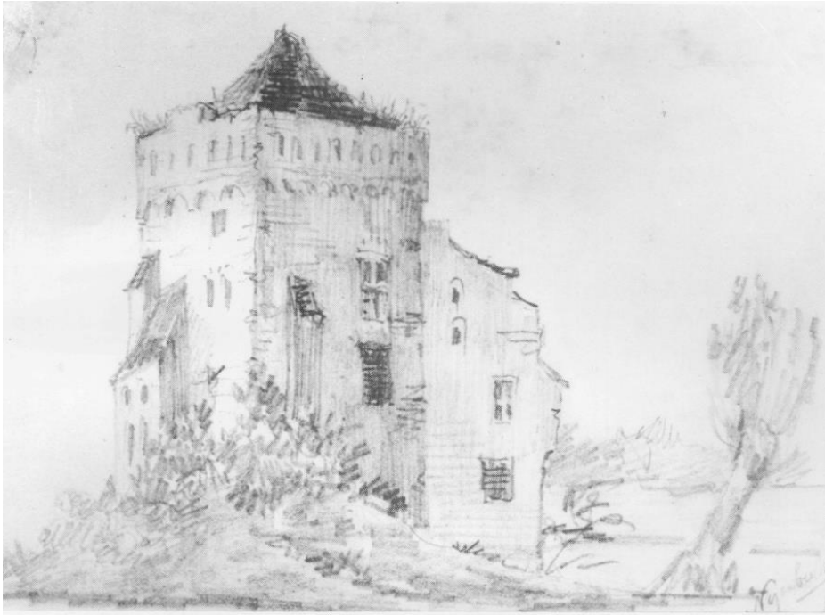
Nr. 15 De Nijenbeek.