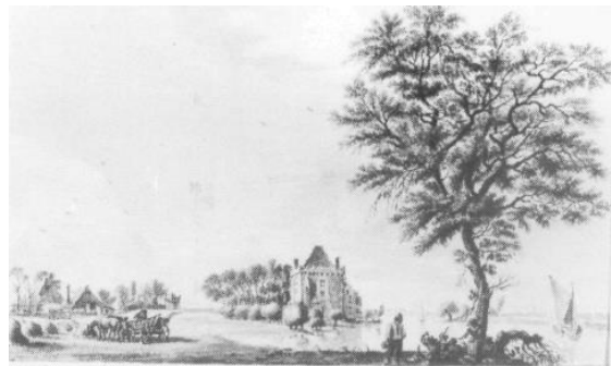
Nr. 21 't Huis Nieuwebeek.